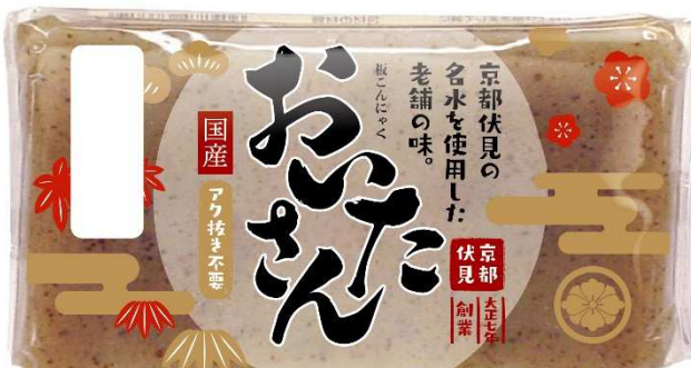
京都伏見の「おいたさん」板こんにやく 220 g (黒) JAN コード : 4903174 152895