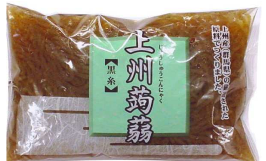
上州蒟蒻 糸こんにやく 200 g (黒) JAN コード : 4903174 686840