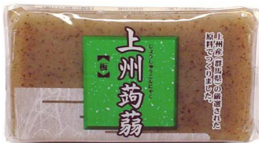
上州蒟蒻 板こんにやく 250 g (黒) JAN コード : 4903174 686819