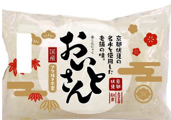
京都伏見の「おいとさん」糸こんにやく 200 g (白) JAN コード : 4903174 252892