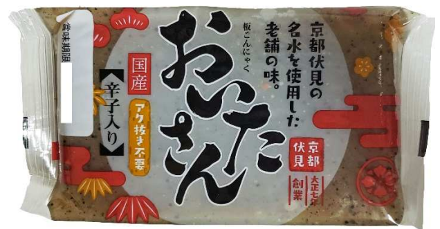
京都伏見の「おいたさん」板こんにやく 220 g (唐辛子入) JAN コード : 4903174 152895