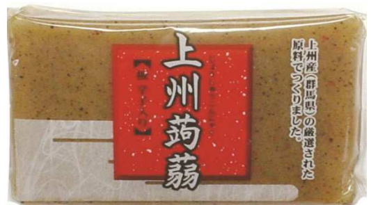
上州蒟蒻 板こんにやく 250 g (唐辛子入) JAN コード : 4903174 686826