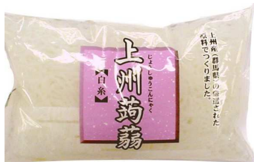
上州蒟蒻 糸こんにやく 200 g (白) JAN コード : 4903174 686855